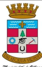
Municipalité du Village de Grenville